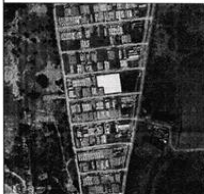
PLANTA BAIXA DE LOCALIZAÇÃO E SITUAÇÃO SEM ESCALA